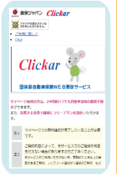
【スマホ画面イメージ】