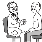
三大疾病になり、通院した。