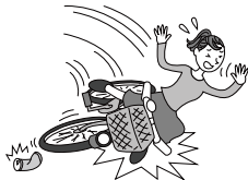
自転車運転中に空缶にハンドルをとられて転倒し、1週間通院した。

日本国内・国外を問わず、所定の交通乗用具との衝突、接触等の交通事故または交通乗用具に搭乗中の事故によりケガをされた場合に、保険金をお支払いします。