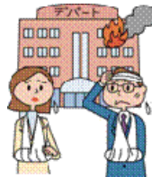
買い物中に火が発生し、火傷を負い、1週間入院した。