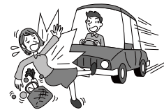
車にはねられ、後遺障害を負った。