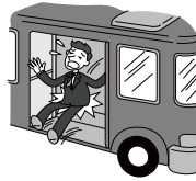
バスから降車する際に、足を滑らせ転倒し、骨盤を骨折し手術をした。