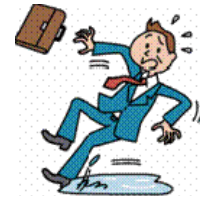
水溜りで足を滑らせ転倒し、手首を骨折し、手術をした。