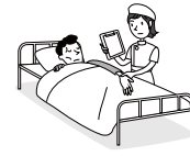
病気になり、入院と手術をした。