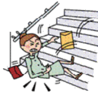
階段を踏み外して転倒し、全身打撲により通院した。

日本国内・国外を問わず、急激かつ偶然な外来の事故（以下「事故」といいます。）によりケガをされた場合に、保険金をお支払いします。