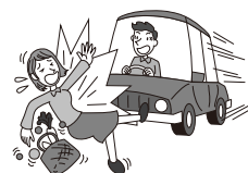
車にはねられ、後遺障害を負った。