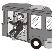
バスから降車する際に、足を滑らせ転倒し、骨盤を骨折し手術をした。