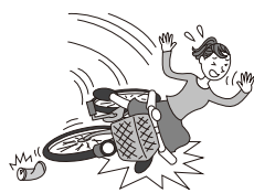
自転車運転中に空缶にハンドルをとられて転倒し、1週間通院した。

日本国内・国外を問わず、所定の交通乗用具との衝突、接触等の交通事故または交通乗用具に搭乗中の事故によりケガをされた場合に、保険金をお支払いします。