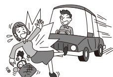
車にはねられ、後遺障害を負った。