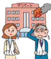
買い物中に火事が発生し、火傷を負い、1週間入院した。