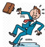
水溜りで足を滑らせ転倒し、手首を骨折し、手術をした。