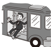
バスから降車する際に、足を滑らせ転倒し、骨盤を骨折し手術をした。