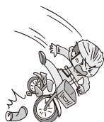
自転車運転中に空缶にハンドルをとられて転倒し、1週間通院した。

日本国内・国外を問わず、所定の交通乗用具との衝突、接触等の交通事故または交通乗用具に搭乗中の事故によりケガをされた場合に、保険金をお支払いします。