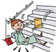
階段を踏み外して転倒し、全身打撲により通院した。

日本国内・国外を問わず、急激かつ偶然な外来の事故（以下「事故」といいます。）によりケガをされた場合に、保険金をお支払いします。