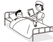
病気になり、入院と手術をした。